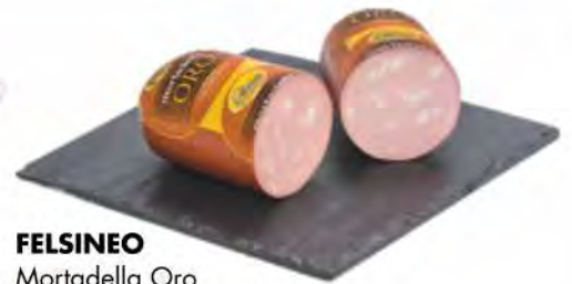
FELSINEO Mortadella Oro metà kg 2 circa