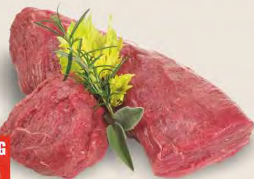
Scamone di bovino adulto sottovuoto