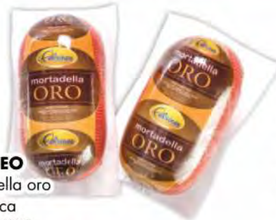
FELSINEO Mortadella oro kg 1 circa