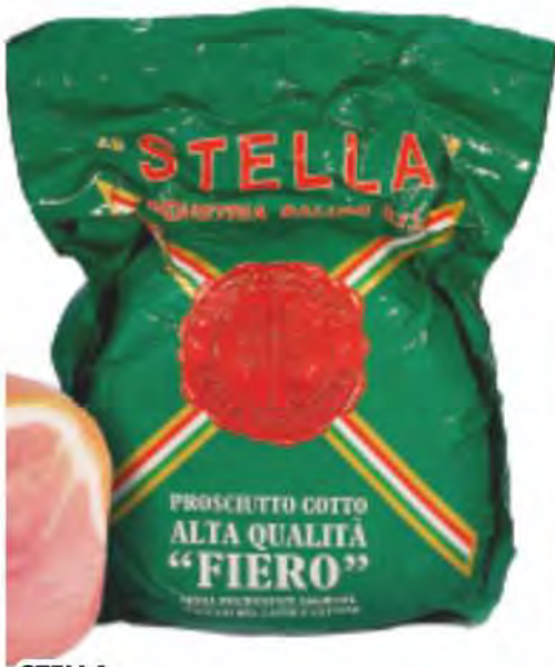
STELLA Prosciutto cotto fiero alta qualità intero