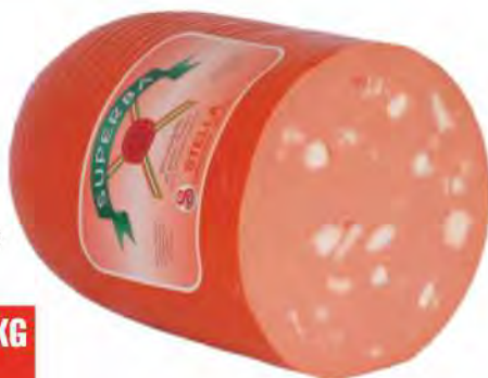
SUPERBA Mortadella Superba