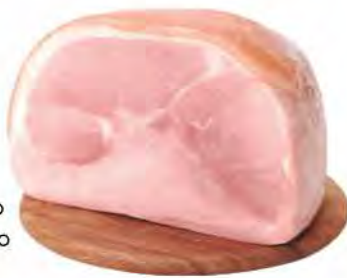
STELLA Prosciutto cotto fiero metà